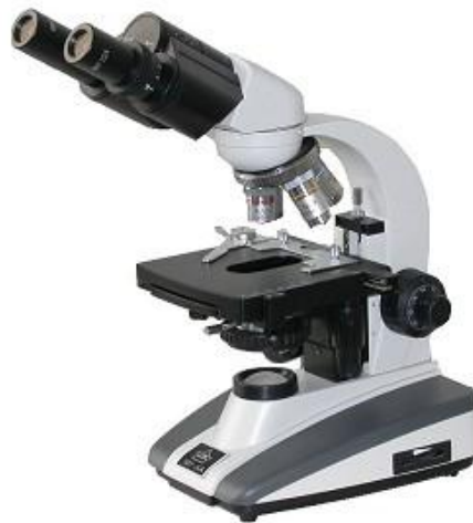
技能操作考试各项目中使用的显微镜