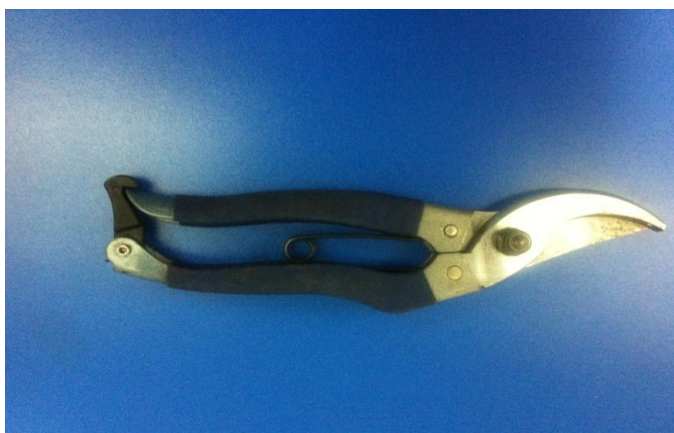
种植类嫁接技术项目中所使用的枝剪