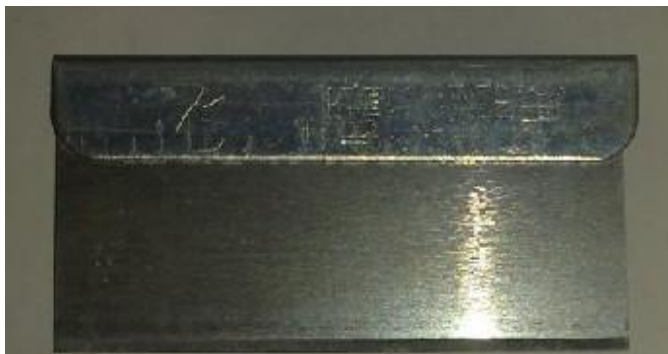
种植类种子活力测定项目中所使用的单面刀片