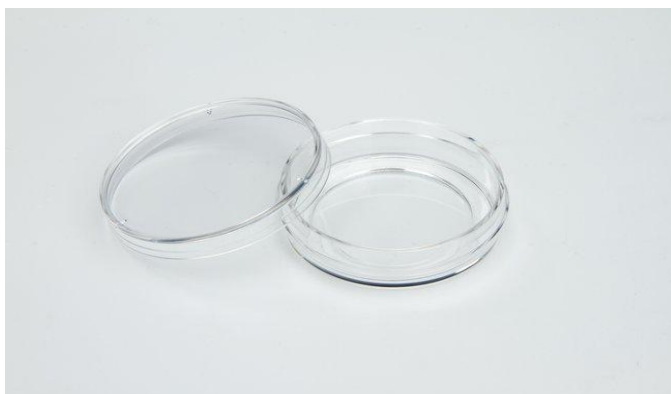
种植类种子活力测定项目中所使用的培养皿