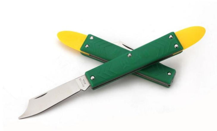
种植类嫁接技术项目中所使用的芽接刀