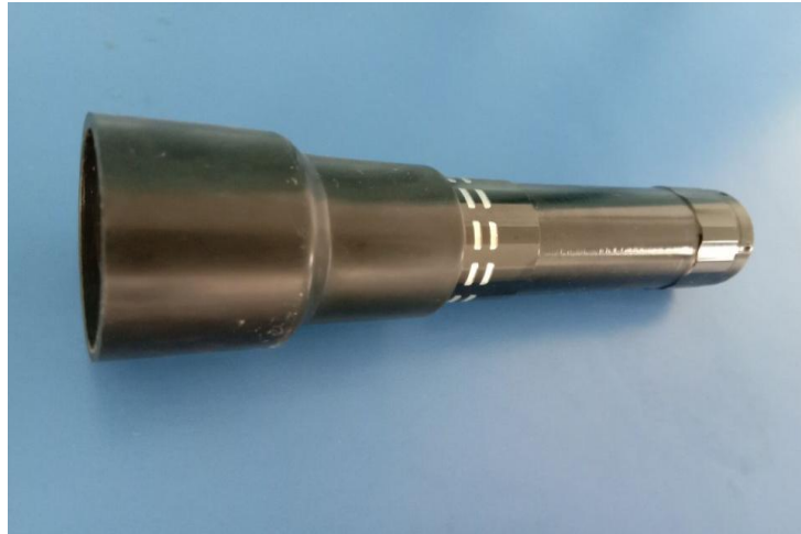
养殖类种蛋的选择与鉴别项目中的照蛋器